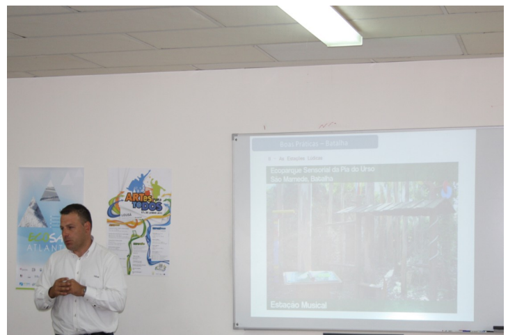
Figura 4 - Ejemplo de Buenas Prácticas, Eco parque Sensorial Pia do Urso - Municipio de Batalha (3ª fase).