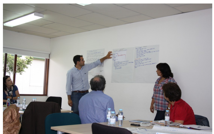
Figura 5 - Dinámica de grupo Taller (3ª fase).