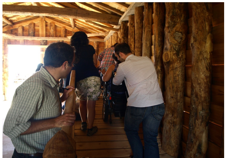
Figura 7 - Rampa de acceso al observatorio (problemas detectados).