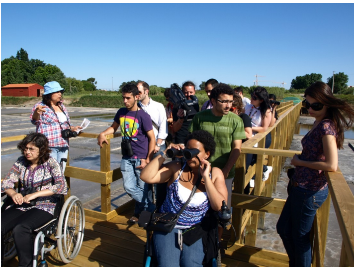
Figura 2 - Visita a la marina Santiago da Fonte (2ª fase).