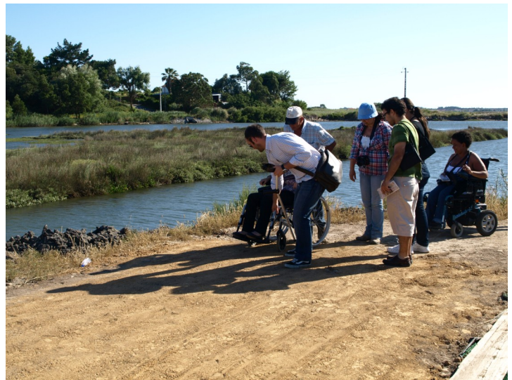
Figura 6 - Accesibilidad del recorrido de visita (problemas detectados).