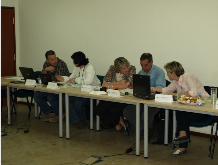
Figura 1 - Presentación del espacio “Marina de Santiago” a las entidades y asociaciones invitadas (1ª fase).