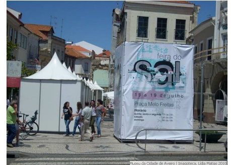
Museo de la Ciudad de Aveiro | Ayuntamiento de Aveiro

En paralelo, los servicios educativos del Museo de la Ciudad proporcionaron al público visitas guiadas al Ecomuseu para observar in situ, el local y las técnicas de producción salina aveirense.